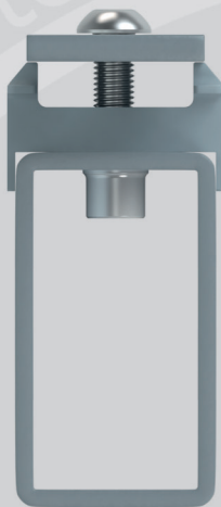
Ansicht Querschnitt Profilrohrpfosten